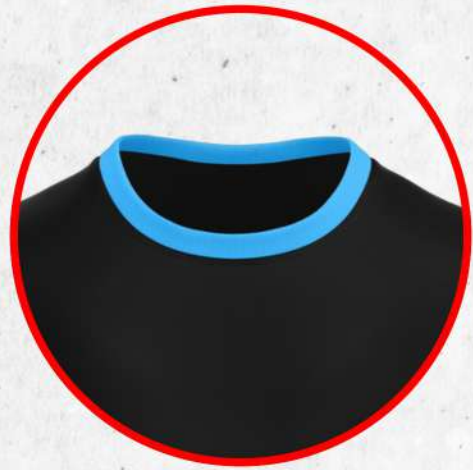
GOLA CARECA (PADRÃO REDONDA)